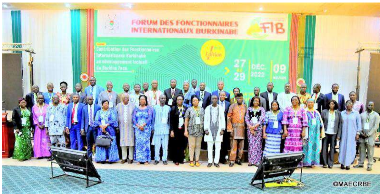
La photo de groupe des participants au premier Forum des Fonctionnaires Internationaux Burkinabè. Le président de l'AAFNU-BF est au 2 e rang, 6 e à partir de la gauche.