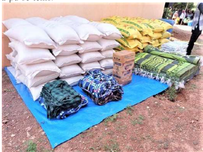
Vue d'un échantillon des vivres et non vivres

L'AAFNU a été invitée par le Président du Conseil National des Personnes Âgées à participer à la commémoration de la JIPA 2022 le 1 er octobre 2022. Elle y a été représentée par le Président, le Secrétaire aux affaires sociales, le Secrétaire à l'information et à la communication et le Trésorier général. Placée sous le thème « La résilience et les contributions des femmes âgées », l'édition 2022 s'est déroulée dans l'enceinte du Centre d'écoute, de soins et de loisirs des personnes âgées, situé dans la Zone 1 à Ouagadougou. Le programme des activités prévoyait (i) la distribution de vivres et de non vivres à des membres du CNPA issus de la région du Centre ; (ii) un marché des personnes âgées dont la spécificité est le fait qu'il soit sans tabac, sans alcool et sans viande rouge et (iii) une séance d'aérobic adaptée. En raison du coup d'état survenu le 30 septembre, seule la première activité a pu se tenir.