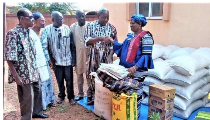
Remise symbolique de dons à une bénéficiaire

Des vivres reçus, il est prévu deux tonnes de chaque céréale pour la région du Centre qui ont été réparties dans les communes de Komki Ipala, Tanghin Dassouri, Saaba et l'infirmerie du Centre d'écoute, de soins et de loisirs des personnes âgées. Les régions des Hauts-Bassins, du Sud-Ouest et des Cascades recevront leur part à savoir 3 tonnes de vivres et de non vivres.