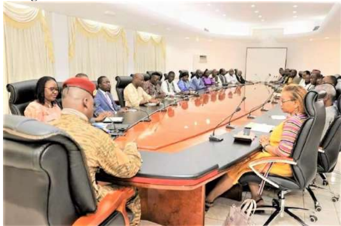
Vue des participants à la rencontre avec le Chef de l'État

3) le 29 décembre 2022, une rencontre directe avec le Président de la Transition, Chef de l'État, le Capitaine Ibrahima TRAORÉ. Le Président de l'AAFNU-BF était membre de la délégation du Forum qui a participé au dialogue direct avec le chef de l'État, le 29 décembre 2022.