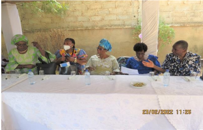
Quelques participants devisent en attendant d'être servis

La partie conviviale a consisté en une séance de photos souvenirs, et un copieux cocktail dinatoire dans une ambiance joyeuse et festive.