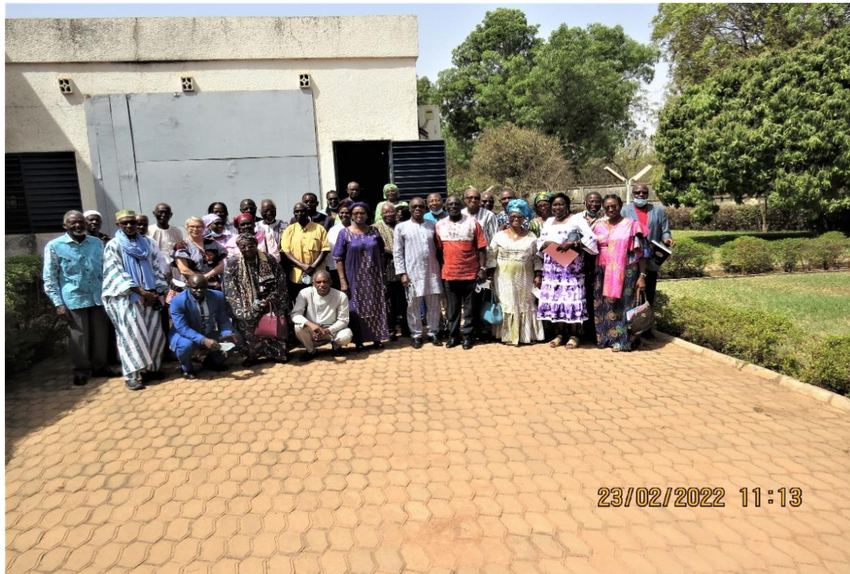
Une vue des participants au pot de Nouvel An 2022