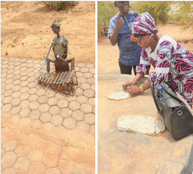
Au musée Koglia nèrè. A gauche un spécimen d'œuvre d'art issu d'éléments récupérés et à droite une meule traditionnelle dont l'utilisation est encore maîtrisée par notre collègue.