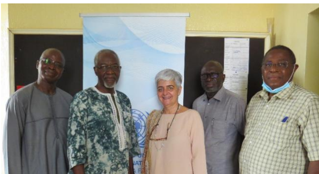
Photo à l'issue de l'entretien avec le Coordinatrice Résidente