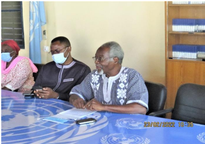
Le Président de l'AAFNU-BF pendant son allocution, avec à ses côtés le Représentant du PNUD

La partie formelle a débuté par une allocution du Président de l'AAFNU-BF. Pour commencer, il a fait observer une minute de silence à la mémoire des membres de l'association et des proches de membres disparus depuis janvier 2019, date du dernier pot de nouvel an.