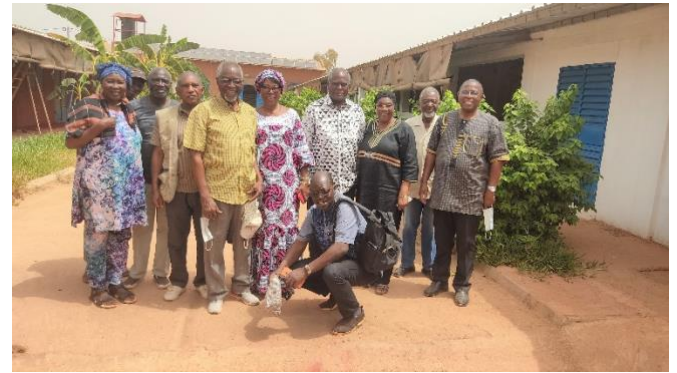
Une partie des visiteurs à la fin de la visite

et sous serre et la culture d'arbres fruitiers, citronniers greffés, manguiers, bananiers à banane douce et bananiers plantains. Ces activités sont rendues possibles grâce à un château d'eau alimenté par un forage à fort débit.