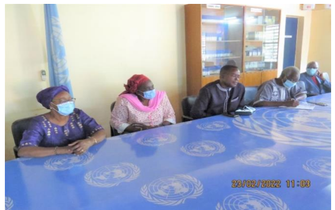
Le Représentant du PNUD pendant son allocution

Il a informé l'assemblée que le Budget Programme de 2022 adopté le 22 décembre 2021, reconduit la plupart des activités évoquées ci-dessus. S'ajoutent à celles-là, des initiatives d'une collaboration avec le Conseil National des Personnes Âgées (CNPA), pour l'établissement d'un réseau de toutes les associations intervenant en faveur du bien-être des personnes âgées et avec les associations du personnel du SNU pour susciter davantage d'adhésions à l'AAFNU et aider à résoudre les problèmes liés au départ à la retraite. Son intervention s'est terminée par des souhaits de bonne et heureuse année 2022 à toute l'assistance. A la suite de cette allocution, le Représentant Résident du PNUD a exprimé ses félicitations et ses encouragements à l'AAFNU-BF pour les réalisations d'activités combien utiles pour les personnels encore en activités. « Nous sommes ce que vous avez été, a-t-il dit, et nous serons ce que vous êtes ». Il a indiqué la disponibilité du Système des Nations Unies au Burkina et plus particulièrement le PNUD à nouer un partenariat avec l'AAFNU-BF tout en lui souhaitant une bonne et heureuse année 2022 ainsi qu'à toute l'assistance.