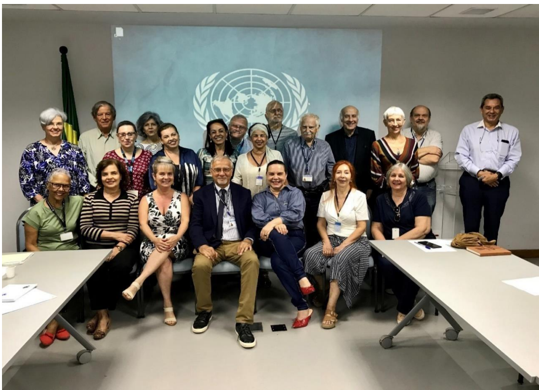
Foto Oficial da Reunião de Brasília